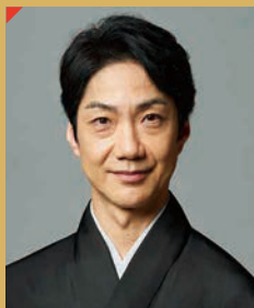
構成・演出：行者・語り 野村萬齋 石川県立音楽堂芸術監督

音楽堂に現れる“異次元ワールド”。 果たしてどんな舞台が出現するのか——どうぞご期待ください!