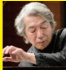
舘野 泉 (左手のピアニスト)