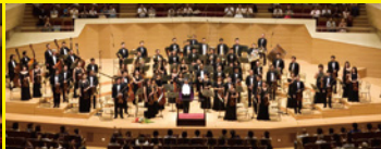
ベトナム国立交響楽団(ベトナム)