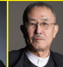
山下 洋輔 (Pf)