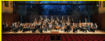
アルトゥーロ・トスカニーニ・ フィルハーモニー管弦楽団(イタリア)