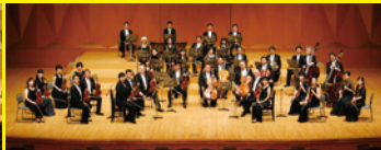
オーケストラ・アンサンブル金沢(日本)