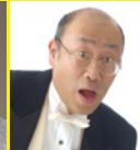
青島 広志 (作曲家)