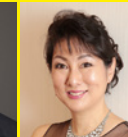
国府 弘子 (Pf・作曲家)