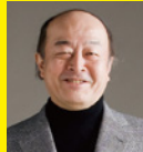
池辺 晋一郎 (作曲家)