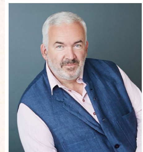
マルク・ミンコフスキ

ブリテン作品ではイギリスの名歌手トビー・スペンスと、オーストリアのホルン奏者ヨハネス・ヒンターホルツァーがソリストとして加わる。妙技を堪能したい。